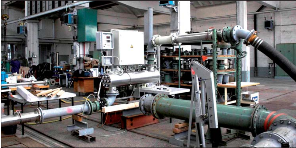
Рис. 3. Испытания УФ-оборудования НПО «ЛИТ» в Венском институте гигиены и микробиологии

В последние годы компания НПО «ЛИТ» продвигает свое оборудование не только в России, но и в других странах. Поэтому аттестация УФ-оборудования по какому-либо из существующих протоколов была необходима для успешной деятельности компании на международном рынке. В 2006–2007 годах серия оборудования НПО «ЛИТ» на амальгамных лампах успешно прошла процедуру аттестации по протоколу ONORM и получила сертификат соответствия Австрийской ассоциации по проблемам воды и газа (OVGW), подтверждающий высокий уровень продукции в соответствии с мировыми стандартами. Аттестация оборудования УДВ-А проводилась Венским институтом гигиены и микробиологии на испытательном стенде в Австрии. На рис. 3 представлен испытательный стенд с оборудованием НПО «ЛИТ».